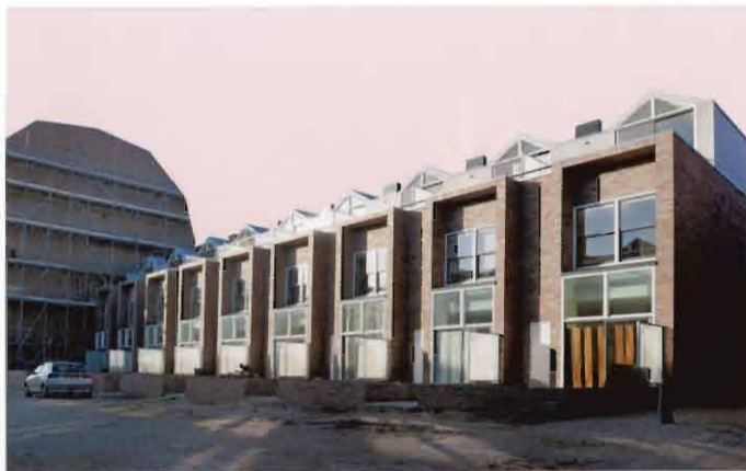
Beneden-bovenwoningen langs de Fabrieksstraat