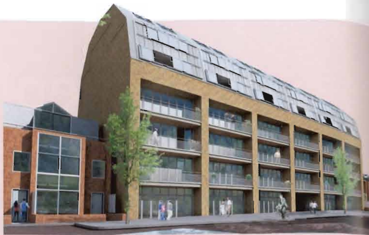
Impressie van één van de 'Behrens'-gebouwen