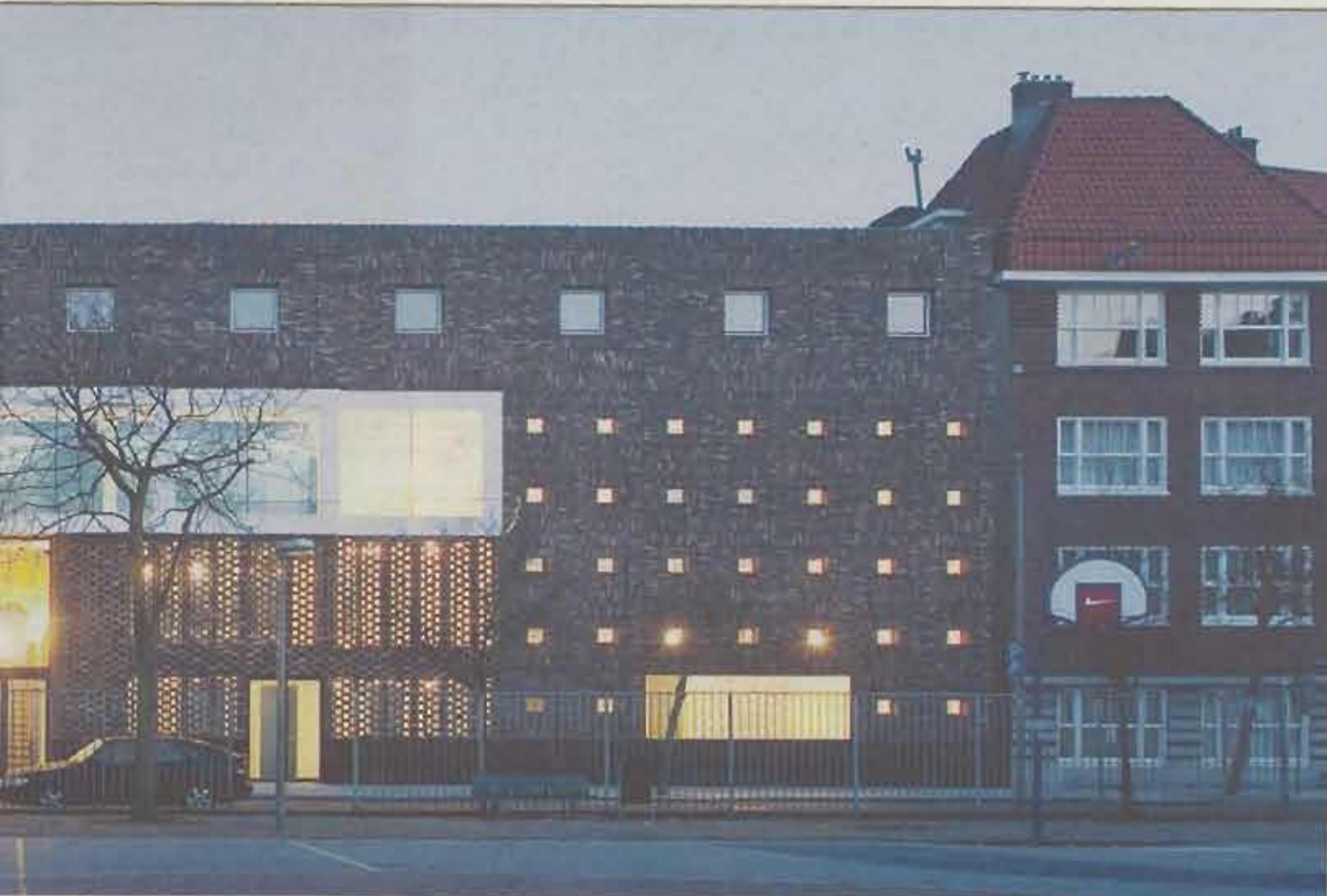
De 'Fusion-moskee' van architect Marlies Rohmer in de Amsterdamse Transvaalbuurt. Foto Luuk Kramer

Ik knipper met mijn ogen. Aan, oud, jong, uit.