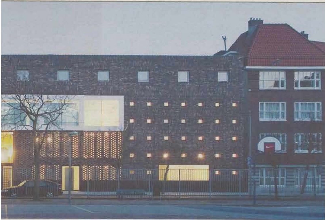
De 'Fusion-moskee' van architect Marlies Rohmer in de Amsterdamse Transvaalbuurt.

Ik knipper met mijn ogen. Aan, oud, jong, uit.